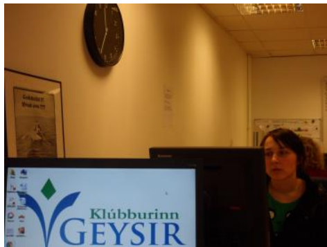
Lísu undirbýr námskeiðið ábúðarfull á svipinn

Í apríl eru fyrirhugaðir tveir fundir, þar sem annars vegar verður kynning á Batastjörnunni og hins vegar kynning á hugmyndafræði Fountain House auk þess sem farið verður yfir sögu klúbbhúsa hreyfingarinnar. Batastjörnufundurinn verður haldinn Þriðjudaginn 14. apríl kl. 14:30 . Hugmyndafræði Fountain House og saga hreyfingarinnar verður haldinn Priðjudaginn 28. apríl kl. 14:30 . Nú er um að gera fyrir fróðleikspyrsta félaga að mæta, því um einstakt tækifæri er að ræða. Einnig viljum við hvetja félaga til þess að taka virkan þátt í kynningarfundunum með því að deila reynslu sinni. Eflum lífandi starf með enn meira lífi. Áhugasamir sem vilja taka þátt og koma að undirbúningi hafi samband við Benna.